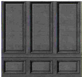
TAPPEZZERIA vinilica su misura Boiserie, variante colore 06 [De/Sign].

Scopri il potere décor di rivestimenti e colori con lavorazioni classiche, ma con un attualissimo effetto tridimensionale.