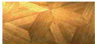
PARQUET a cassettoni Jura, in rovere spazzolato [Iperceramica € 76/mq].