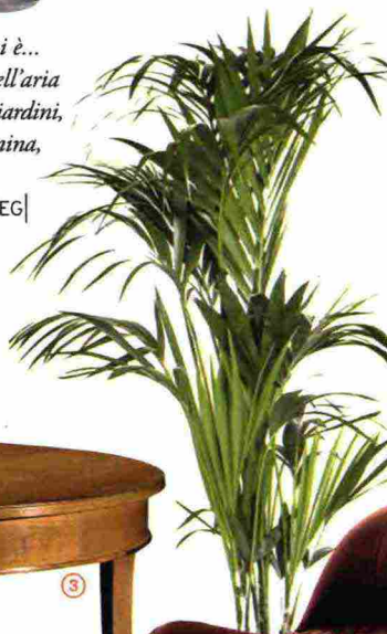
Scenografica la PIANTA Kenzia, da interno con vaso in ceramica [Lezio, cm 140h € 63].