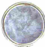
PITTURA decorativa Hoblio colore nei Toni Freddi, con leggere sfumature riflettenti [Candis].