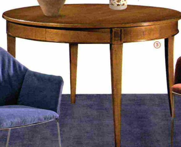
Velluto e gambe in finitura ottone nella SEDIA Queen [Bontempi Casa, cm 65x63x89h da € 815].