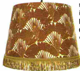
Palme stilizzate e paralume bordato con frange oro nel LAMPADARIO in lino Ravenala [Mindthegap, ø cm 35x30h € 284].

Forme vintage e colori trendy (ottanio e terracotta), fantasie floreali ma in chiave moderna, tocchi animalier: così lo stile romantico ha un volto nuovo